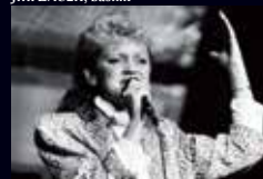
PETRA JANŮ, zpěvačka